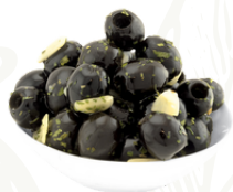
Small Pitted Black Olives with Garlic

Product Code : ITA0005 Packaging Size : 1.9 KG X 1 TU