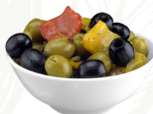
Olives Mix Italia

Product Code : ITA0033 Packaging Size : 1.9 KG X 1 TU