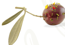
Marinated whole Black Olives

Product Code : ITA0008 Packaging Size : 1.9 KG X 1 TU