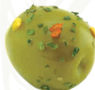
Marinated Large green olives in oil

Product Code : ITA0007 Packaging Size : 1.9 KG X 1 TU