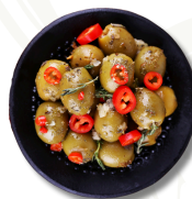
Pitted Green Olives Marinated with Hot Spices

Product Code : ITA0006 Packaging Size : 1.9 KG X 1 TU