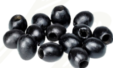
Small Pitted Black Olives in Oil

Product Code : ITA0014 Packaging Size : 1.9 KG X 1 TU