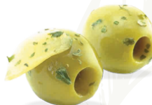
Large green whole olives with Garlic

Product Code : ITA0002 Packaging Size : 1.9 KG X 1 TU